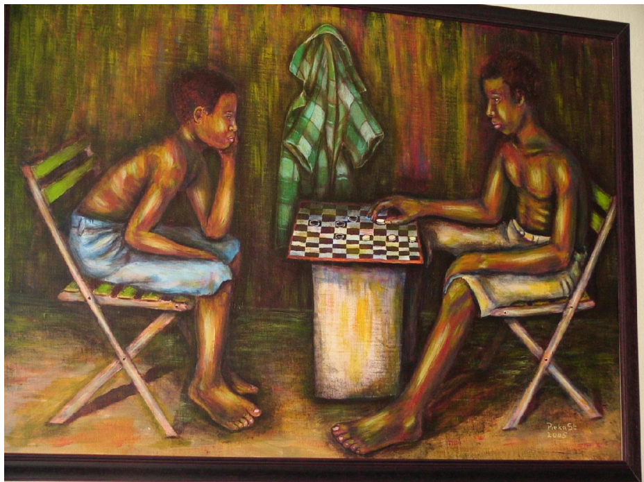
De dammers, gemaakt door Sten Pieka

Dat in de Marroncultuur kunst ingebed is in het dagelijkse leven, mag bekend verondersteld worden: Houtsnijwerk- en kalabasmotieven, textielkunst, traditionele bouwstijl en haarvlechtkunst. Over de traditionele kunst van de Marrons zijn al diverse boeken geschreven. De vakmensen uit de Marronsamenlevingen, die van generatie op generatie een traditionele scholing kregen om de talrijke symbolen te verwerken in allerlei gebruiksvoorwerpen, waren ware kunstenaars. Opvallend zijn de kleurschakeringen, de symmetrie en de precisie waarmee gewerkt werd. Hun vakmanschap was meesterschap. Zij gaven aan het werk hun inspiratie mee, waarop een volgende generatie weer voortborduurde.