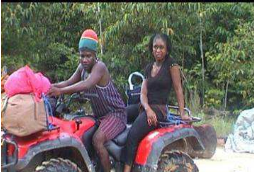
Op de ATV naar een goudmijn

Het is niet zo een groot voertuig, dus veel plek heb je dan niet. Daar gingen we. Op en af door het oerwoud. Het leek wel een safaritocht. De natuur was werkelijk schitterend. Vogelgeluiden en alleen maar bos. En toen dook zomaar uit het niets een gebouw op, midden in het oerwoud. Het bleek een winkeltje te zijn. Een bord aan de voorkant gaf de prijzen van de goederen in goud aan. Bij de winkel kan je ook kamers huren om te overnachten. De rit met de ATV het oerwoud in duurde twee uur. Geradbraakt kwamen we aan bij het goudzoekerkamp waar wij zouden overnachten. Mijn vader sprak af met de chauffeur dat hij ons morgenochtend zou komen ophalen.