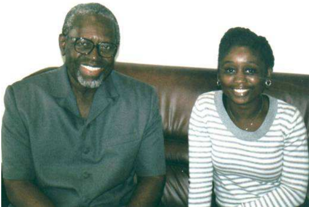
Bij president drs. Ronald R. Venetiaan

Om tien uur vond bij Cultuurstudies de uitreiking plaats van de Gaanman Gazon Matodja Award.